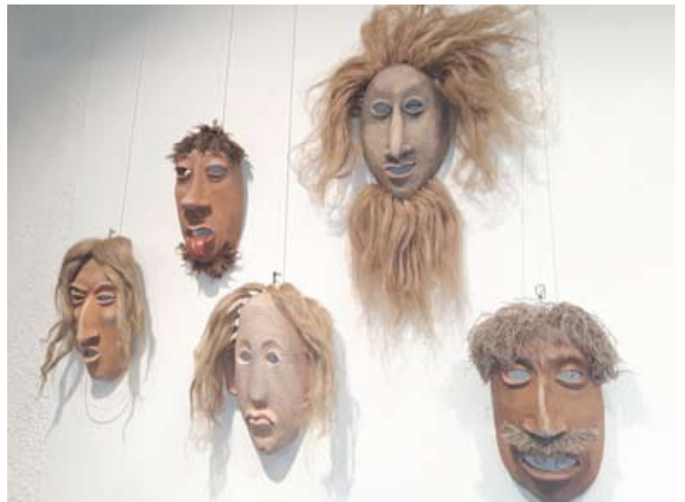
Skaidrės Račkaitytės sukurta keraminės kaukės.