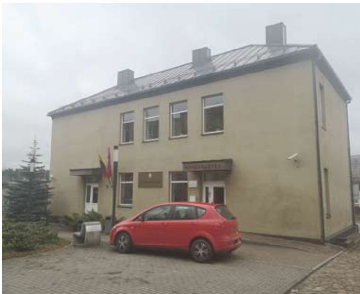
Šiame prokuratūros pastate Anykščiuose, S.Daukanto gatvėje, šiuo metu dirba du prokurorai ir jų padėjėja.

Prokurorų darbo vietas numatyta naikinti ir Anykščiuose. Iniciatoriai teigia, kad tokia idėja svarstoma ne tik dėl lėšų taupymo, bet ir įvertinus nevienodą darbo krūvį.