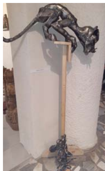
Rimanto Tuskenio metalinis katinas ir pelė...