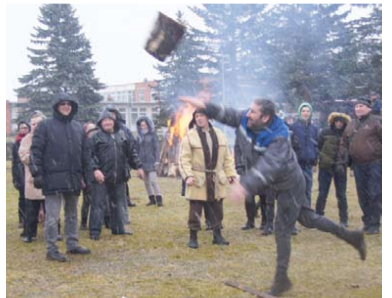
Žaidimai. Kaladės mėtymas - kas toliau?

Gavėnas pripažino, kad jis nėra pats geriausias, tačiau patys didžiausi blogiukai esą Lašininis