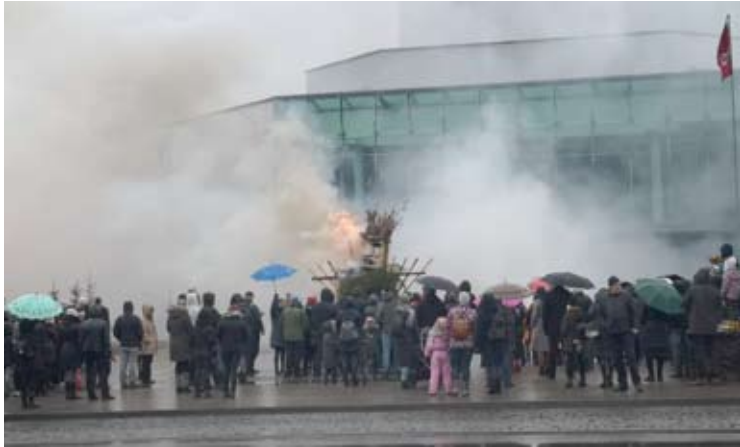
Anykščiuose deginamas Gavėnas uždūmijo visą miesto centrą.