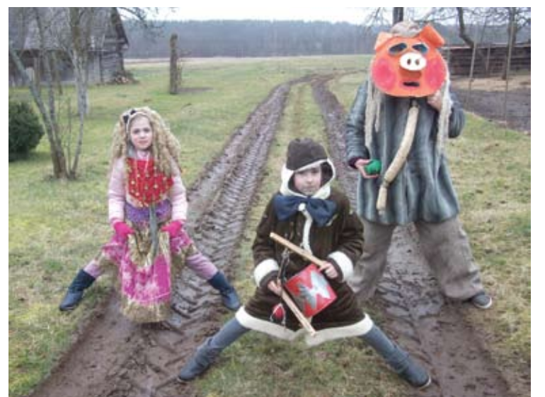
Būdavo, per Užgavėnės dar tik „vėžė krypta“...