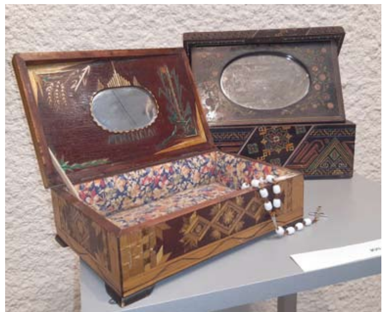
Jono Kadžionio tremtyje išdrožtos dėžutės...